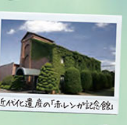
近代化遺産の「赤レンガ記念館」