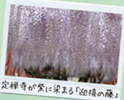
定禅寺が紫に染まる「迎接の藤」