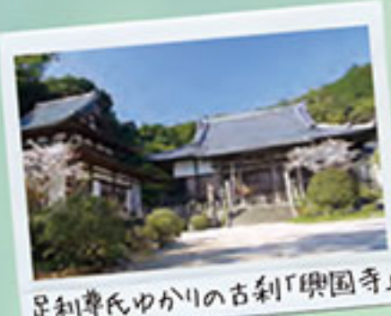
足利氏ゆかりの古刹「興國寺」