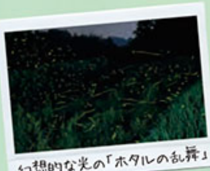
幻想的な光の「ホタルの乱舞」