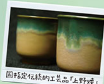
園指定伝統的工芸品「上野焼」