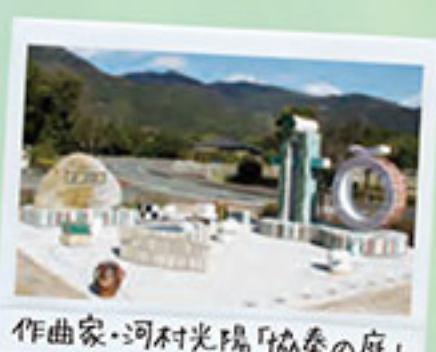
作曲家・河村光陽「協奏の庭」