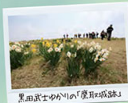
黒田武士ゆかりの「原野の城跡」