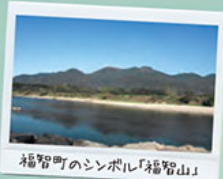
福智町のシンボル「福智山」