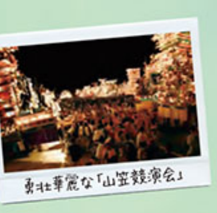
東北華やかな「山笠鼓楽会」