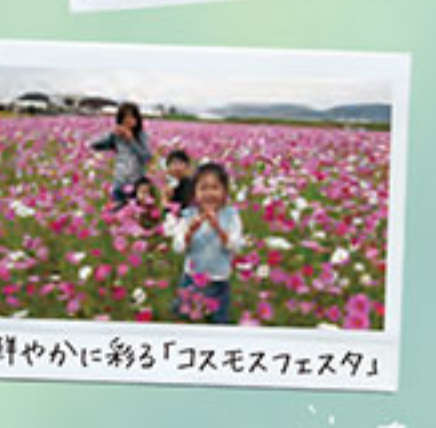
鮮やかに彩る「コスモスフェスタ」