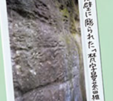
岩壁に彫られた「群芳亭茶室」