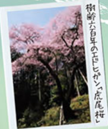
樹齢六百年の「巨匠」の桜