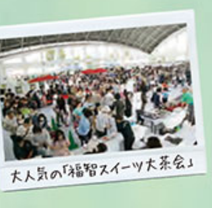
大人気の「福智スイーツ大茶会」