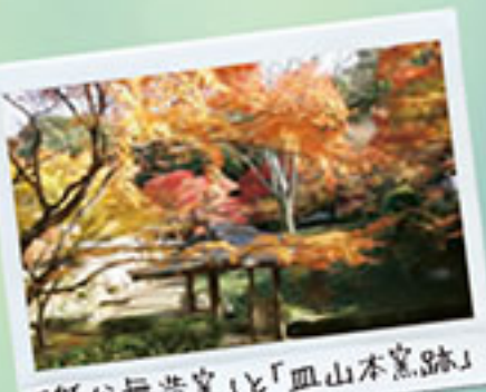
「熊谷無造窯」と「血山本堂跡」