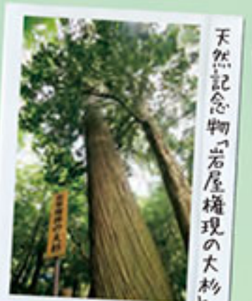
天然記念物「岩屋権現の大杉」