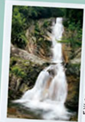
落差25mの瀑布「白糸の滝」