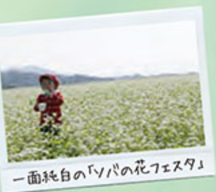
一面純白の「ソバの花フェスタ」