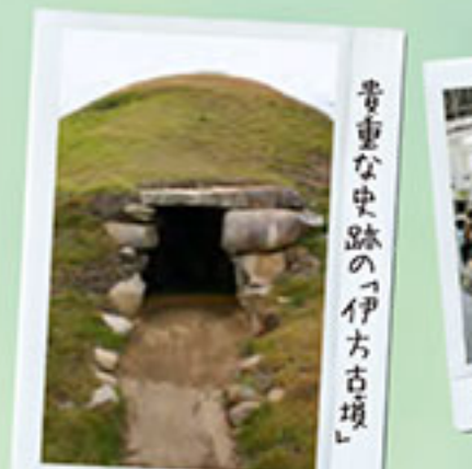
貴重な史跡の「伊方古墳」